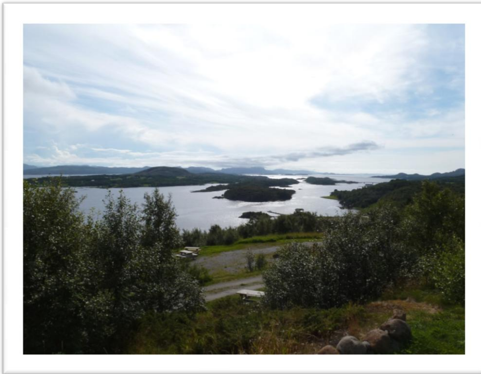
(Het prachtige uitzicht in Leka)