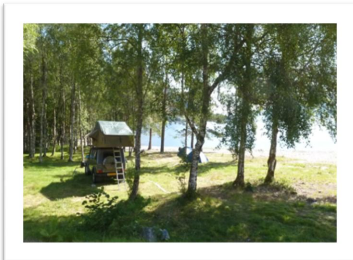
(Van de gebaande wegen af)

We hebben daar een dag of 4 gestaan en na een dag of twee arriveerden er nog andere Nederlanders die naar onze kamp keken en vroegen: "Zijn jullie met dat Jeepie gekomen?"